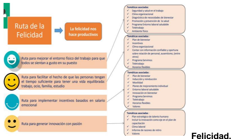
Figura No.01 Ruta de la Felicidad.

De esta manera y aportando a la proyección institucional de hacer de Boyacá el departamento con las vías más seguras del país, surge la imperiosa necesidad de garantizar una óptima prestación de los servicios y de conformidad con la Ley 909 de 2004, en su Capítulo II, Artículo 15, Numeral Segundo, Literal E, en concordancia con el Decreto 1083 de 2015, que grosso modo señala a cada entidad estatal el deber de planear, ejecutar y hacer seguimiento de un Plan Institucional de Capacitación, entre otras disposiciones de orden legal, el ITBOY busca cumplir con lo orientado y por lo mismo, promover en el personal capacitaciones permanentes que generen en ellos mayor capacidad técnica para un mayor impacto laboral.